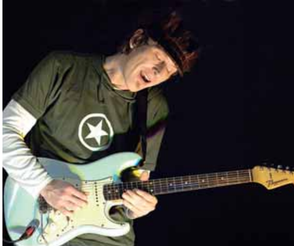
Für das Konzert von Errorhead am Samstag, 15. Mai, im Teamsports in Bedburg-Hau verlosen die Niederrhein Nachrichten fünf Fanpakete.