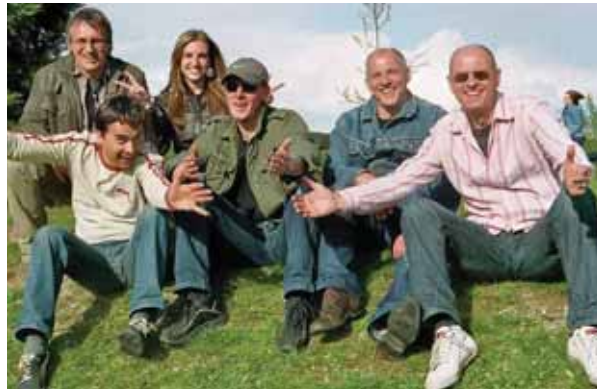
„Fine rockt“ heißt es am Sonntag, 10. Mai, ab 13.45 Uhr auf der Webermarkt-Bühne. Die Viersener Band spielt erstmals live in Nieukerk.