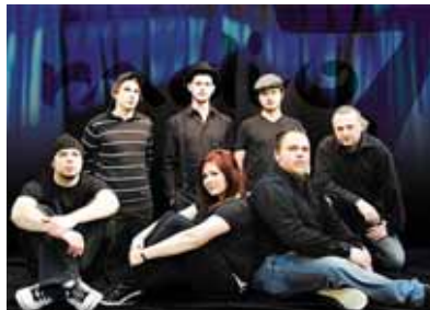
Am Samstagabend startet die Party mit „Radio 7“.

Auch der Sonntag wird das Fest um 11 Uhr mit dem Konzert des Musikvereins Nieukerk, des Nieukerker Männergesangsvereins, des Trommlerchors Nieukerk, Cäcilia Stenden und des Jugendorchesters des Musikvereins eröffnet. Zudem wird der Heimatverein um 12 Uhr seine Weberaufgabe durchführen. Um