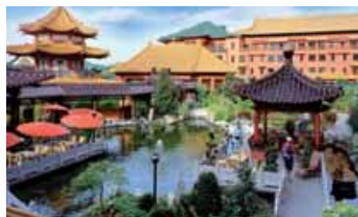
Das Hotel Ling Bao ist ein Ort voller Ruhe und Behaglichkeit, in dem die Lehre des Feng Shui angewendet wurde.