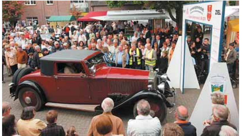
Schätzchen in Lack und Chrom rollten in Sevelen auf dem Marktplatz durch das Ziel. Hier fand zum 4. Mal das Oldtimer-Festival statt. Autos, Motorräder und Trecker standen im Mittelpunkt des „rollenden Museums“. Die Interessengemeinschaft Sevelen als Veranstalter konnte auch diesmal wieder zahlreiche Besucher und Liebhaber der alten Fahrzeuge im Dorf begrüßen. Während sich die Oldtimer auf ihrer Tour befanden, sorgte ein Programm auf dem Markt für Unterhaltung.

*Angebotspreis mit rechnerischer Einbeziehung der staatl. Umweltprämie gemäß den Bedingungen des Bundesamtes für Wirtschaft und Ausfuhrkontrolle (BAFA) www.bafa.de und zusätzlicher Einbeziehung des durch die Ford-Werke GmbH gewährten Umweltbonus. Voraussetzung für den Hauspreis ist der Nachweis des Besitzes eines Ford Fahrzeugs, das zum Zeitpunkt des Neuwagen Kaufvertrags mindestens 6 Monate ununterbrochen auf den Käufer zugelassen ist. (Halteridentität). Ansonsten erhöht sich der Hauspreis um € 500,-. Überführungskosten incl. Safe- und Easypaket zzgl. € 695,-. Kraftstoffverbrauch (in l/100 km nach RL 80/1268/EWG): 8,7(innerorts), 5,4(außerorts), 6,6(kombiniert). CO - Emission:157 g/km (kombiniert).