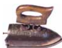
Historische Bügeleisen stellt Franz-Peter Götz im Haus Lawaczek aus.

Bei gutem Wetter findet vor dem Haus ein Bücherflohmarkt statt, bei Regen im Haus Lawaczek. Tausende Bücher (Dubletten) aller Art, darunter viele seltene Ausgaben zur niederheinischen Geschichte werden am Sonntag ab 10 Uhr angeboten. Um Platz zu schaffen, bietet der Historische Verein diese mehrfach vorhandenen Bücher zu sehr günstigen Preisen an. Auch