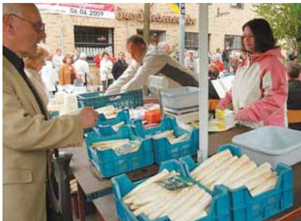
Das weiße Gold darf auf dem Spargelmarkt natürlich nicht fehlen. Über 50 Stände lockten die zahlreichen Besucher nach Walbeck. Die Interessengemeinschaft Walbecker Geschäftsleute, Handwerker, Gastronomen und anderer Selbstständiger hatte wieder viele interessante Handwerke für den gemütlichen Markt gewinnen können. Unter anderem wurden Geigen gebaut, Flachs geklopft, Hörner geschnitten und Teddybären hergestellt.