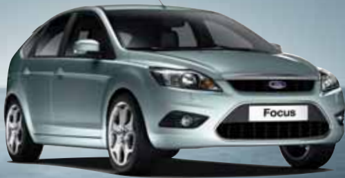
Abbildung zeigt Lim. 5-türig mit Wunschausstattung gegen Mehrpreis.

€ 16.850,- Fahrzeugpreis - € 2.500,- staatl. Umweltprämie - € 2.000,- Ford Umweltbonus €12.350,- € 9.990,- unser Hauspreis*