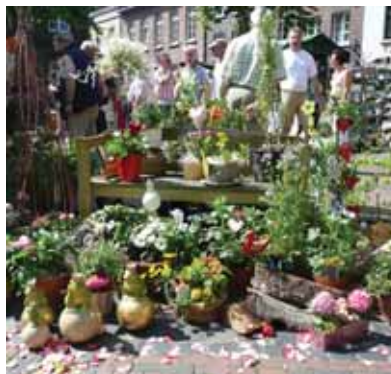
Mit Blumen sieht die Welt viel schöner aus: Zum Frühlings- und Blumenmarkt lädt der Verkehrsverein Straelen am kommenden Samstag, 9. Mai, ein.

Die Straelener Blumenspezialisten bieten aber noch mehr: Zum Beispiel kunstvoll gebundene Sträuße und Gestecke für