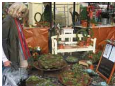
Moderne Floristik von kreativer Hand komponiert.

Vielzahl kombinierbar können auf diese Weise wunderbare warme Farbtöne miteinander in Kübel und Kästen harmonieren. Vor allem für den Verbraucher bringen diese Züchtungen den Vorteil, lange haltbar zu sein und auch später