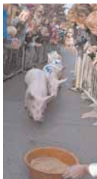
Kerkener Jugendgruppen schicken die Ferkel ab 13 Uhr auf die Rennstrecke.

► NIEUKERK. Traditionell lädt der Nieukerker Werber zum Herbstkirmes zum verkaufsoffenen Sonntag und zum Herbstfest ein. So bieten auch in diesem Jahr die Geschäftsleute am 12. Oktober ab 11 Uhr die Gelegenheit zu einem Einkaufsbummel außerhalb der regulären Öffnungszeiten. Zudem wird unter dem Motto „In Nieukerk ist die Sau los“ ein „tierisches“ Rahmenprogramm veranstaltet.