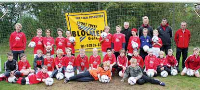
28 Jungs und Mädchen ließen sich beim SV Issum von Wind und Regen nicht abschrecken und verbrachten vier lehrreiche Tage im Jako-Fußball-Trainingscamp.