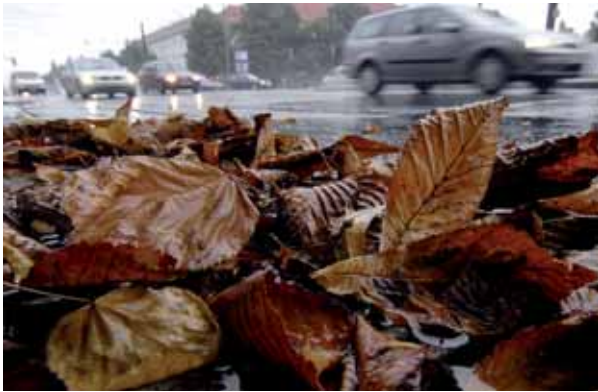
Wenn das Wetter nass wird, bieten nur zugelassene Reifen den optimalen Schutz.

Den Antrieb der Limousine besorgt ein verbrauchsoptimierter 2,0-Liter-Dieselmotor mit 80 kW/120 PS. Darüber hinaus ist unter anderem das Motor-Kühlsystem bedarfsgerecht ausgelegt, wodurch im inaktiven Zustand keine Antriebsleistung beansprucht wird. Außerdem wird zeitweise die Klimaanlage vom Motor abgekoppelt sowie ein sogenanntes Rekuperationssystem genutzt, das die Bremskraft in elektrische Energie verwandelt. Die Hinterräder sind mit elektrischen Bremsen ausgestattet. Kombiniert ist der Motor mit einem lang übersetzten Sechsgang-Schaltgetriebe, das sich durch geringe Reibung und leichtes Gewicht auszeichnen soll. Ein Start-Stopp-System schaltet das Aggregat im Leerlauf ab. Der Luftwiderstand des Fahrzeugs wurde unter anderem durch einen aufwendiger verkleideten Unterboden und ein verändertes Heck gesenkt; ein Heckdeckel mit Abrisskannte zielt das Hinterteil der Studie. Bei der Beleuchtung werden LED-Leuchten eingesetzt. Auch der Faktor Mensch wurde bei dem Konzept berücksichtigt: Zu einer ökonomischen Fahrt verhelfen eine Schalthandlung sowie ein Trainingsprogramm.