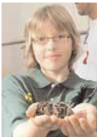
Exotische Spinnen präsentieren die Aussteller im Adlersaal.

Im Rahmen der Ausstellung stellt auch die Zoologische Gesellschaft für Arten- und Populationenschutz e.V. den Fonds für bedrohte Papageien vor. Dieser Fond unterstützt weltweit Projekte zur Erhaltung gefährdeter Papageienarten.