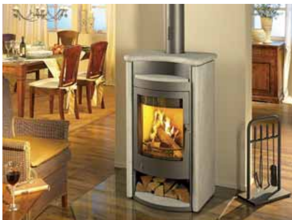
Feste Brennstoffe, wie Holz oder Braunkohlebriketts, sind noch für viele Jahrzehnte in ausreichender Menge verfügbar.

Braunkohlen- und Holzbriketts, Kaminholz und Anzündhilfen sind im Fachhandel sowie in Verbraucher- und Baumärkten erhältlich. Diese qualitativ hochwertigen Briketts sind von Natur aus schwefelarm, garantiert frei von Bindemitteln und zeichnen sich durch einen besonders hohen Heizwert aus.