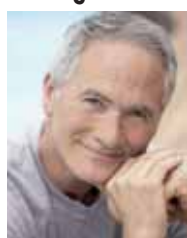
Wer nicht mehr gut hört, ist am Anfang oft verzagt. Doch das ändert sich, denn es gibt sehr gute Lösungen, um Hörschwächen auszugleichen.

Irgendwann ist es nicht mehr zu leugnen: der eigene Hörverlust. Man braucht ein Hörgerät. Nach einem detaillierten Hörtest beim Hörgeräteakustiker erfolgen Wahl und Einstellung eines Hörsystems. Der Betroffene probiert verschiedene Hörsysteme aus, der Akustiker stellt sie auf dessen Hörfähigkeit ein, justiert die Geräte noch – so lange, bis ein bestmögliches Hör-Erlebnis erreicht ist. Teilweise erleben Betroffene beim ersten Tragen der Hörsysteme die Welt als viel zu laut. „Raschelndes Papier klingt wie ein knatterndes Moped“, berichtete kürzlich der Buchautor Gerhard Wissler auf dem 53. Internationalen Hörgeräteakustiker-Kongress in Leipzig. Dies ist jedoch nicht von Dauer. Martin Blecker, Vorsitzender der Europäischen Union der Hörgeräteakustiker e. V.: „Solche anfänglichen Eindrücke entstehen, weil Hörverluste eine Hörentwöhnung bewirken, sodass das Gehirn sich an das MehrHören erst wieder gewöhnen muss.“ Deshalb sollten die Geräte nicht nur gelegentlich getragen werden, so Blecker. Das, unter anderem, hat auch Gerhard Wissler beherrzigt. „Inzwischen“, sagt er, „sind die Hörgeräte für mich hilfreiche Freunde. Heute erlebe ich: Ich bin schwerhörig und fühle ein aktives, selbstsicheres Leben.“