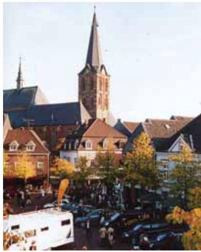
Der historische Marktplatz bietet die Kulisse für die Mobilitätsschau am kommenden Sonntag.

Geschenkscheine werden immer beliebter. Deshalb hat der Werbering Geschenkscheine im Wert von 5, 10 und 25 Euro anfertigen lassen. Sie sind bei der Sparkasse, der Volksbank, beim Bürgerservice der Stadt und bei Edeka Dahmen erhältlich und können von