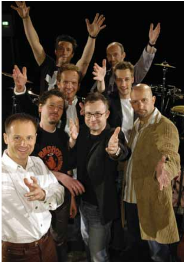
„Superdream“ covern am 8. November in Straelen die Hits der Erfolgsband der 70er und 80er Jahre: Supertramp.