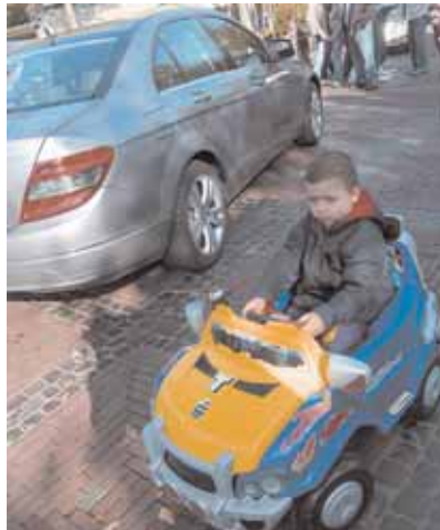
Für jede Größe das passende Gefährt. Ein vielfältiges Angebot erwartet die Besucher in Straelen.

den Kunden in den über 100 Mitgliedschaften, auch am Sonntag, eingelöst werden.