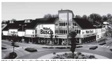
Möbel Busch, Breyller Straße 93-103 in Nettetal-Lobberich