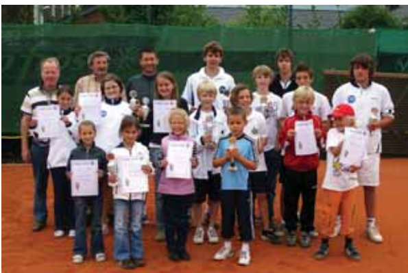
Beim TC BW Issum wurden nun die Tennis-Clubmeisterschaften ausgetragen.