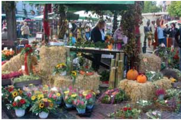
Eine bunte Vielfalt präsentiert der Blumenmarkt zum Beginn der „dunklen Jahreszeit“.

GRILL- UND PARTYSERVICE SB-LANDMARKT ZERLEGEBETRIEB