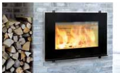
In den kalten Herbst- und Wintermonaten gibt es kaum etwas Schöneres als ein prasselndes Feuer.

Einmal angezündet, muss nur noch darauf geachtet werden, dass rechtzeitig Holz nachgelegt wird. So eine Automatik ist nicht nur bequem, dank optimaler Luftzufuhr wird auch ein maximaler Wirkungsgrad erreicht und damit die bestmögliche Ausnutzung des Brennstoffes sichergestellt. Das schont ganz nebenbei auch die Umwelt.