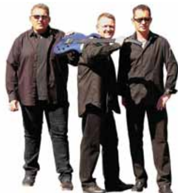
Die Band „Dolce Vita“ spielt zum Tanz auf.

Der Eintrittspreis beträgt 6,50 Euro. Für die Besitzer von Losen ermäßigt sich der Eintritt auf 4 Euro.